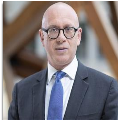
Yr Arglwydd Wolfson o Dredegar CF, Is-ysgrifennydd Gwladol Seneddol