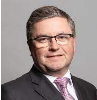
Y Gwir Anrhydeddus Robert Buckland CF AS. Arglwydd Ganghellor a'r Ysgrifennydd Gwladol dros Gyfiawnder