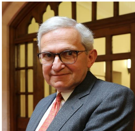
Syr Geoffrey Vos, Meistr y Rholiau a Phennaeth Cyfiawnder Sifil